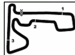
Franciacorta 2.519 m